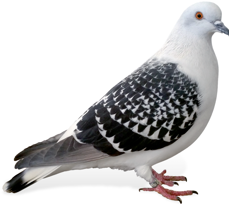
Rasse des Jahres 2024 im BDRG: Eistaube, Foto: Dr. Jens Herbert